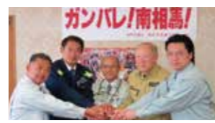
東日本大震災時、交流自治体相互が連携した水平的支援により南相馬市復興の後押しを実現。